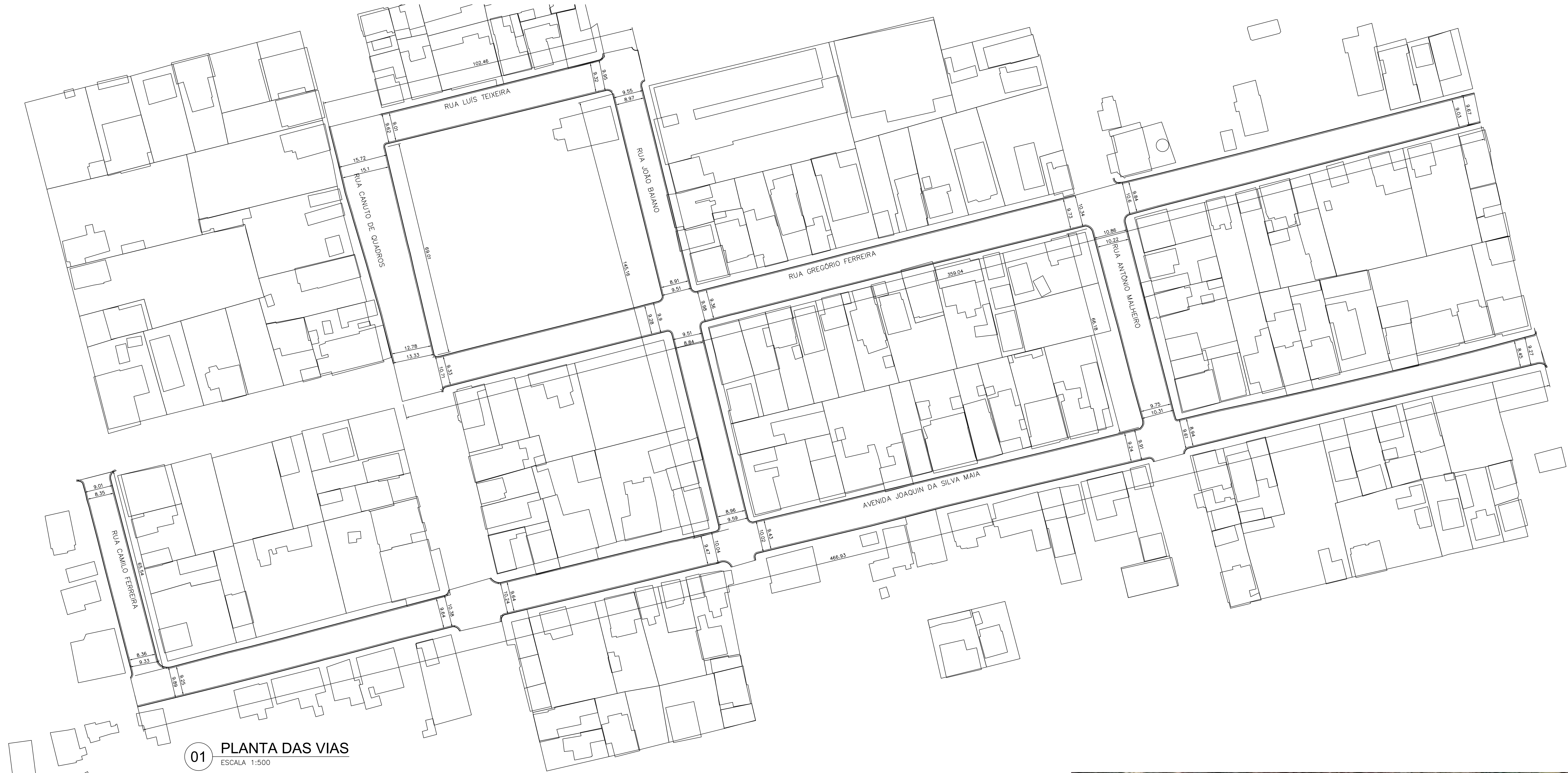
01 PLANTA DAS VIAS ESCALA 1:500